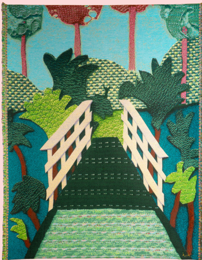
KIKI VAN EIJK, THE BRIDGE, 2025 Tapisserie tissée Jacquard, technique mixte de chanvre, papier, mohair, 223 × 174 cm, collection «Memories of a Garden», éd. de 20 ex. Galerie Spazio Nobile (Bruxelles).