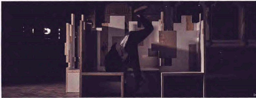
14 — Serge Leblon, Le Combat , 2020, photographie, encadrée et signée par l'artiste /photograph, framed and signed by the artist, Ed. 5+2 AP 15 — Serge Leblon, La Quête , 2020, photographie, encadrée et signée par l'artiste /photograph, framed and signed by the artist, Ed. 5+2 AP

empirical way in which chaos is a basis for permanent reflection. It all fell into place quite easily, and very naturally.