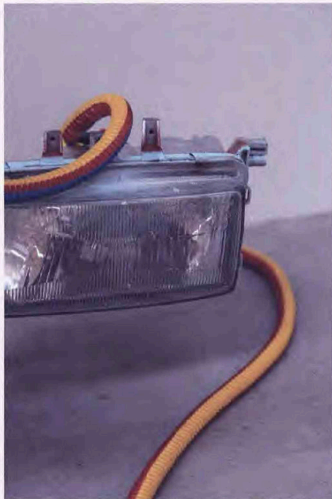
1 — Lionel Jadot, Gilga V , 2020, parure lumineuse /lighting adornment