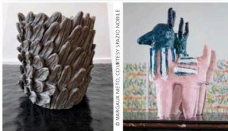
Vase en terre cuite, Cylinder Serie , en grès.