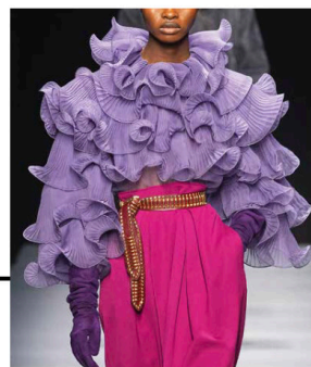
Silhouette automne-hiver 2020, ALBERTA FERRETTI.