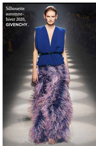
Silhouette automne-hiver 2020, GIVENCHY.