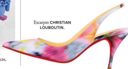
Escarpin CHRISTIAN LOUBOUTIN.

PHOTOS PRESSE - GALERIE SPAZIO NOBILE - GALERIE FRACAS