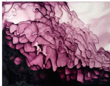
Paysage-sentiment (violet) , AMY HILTON, 2019, encre sur papier calque solo, galerie Spazio Nobile, Bruxelles.

Surimpressions, tie & dye, volutes et volumes... Les effets de matière créent une illusion de profondeur.