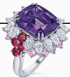
Bague de la collection "Winston Candy", spinelle pourpre taille coussin, saphirs roses, rubis et diamants, monture en platine, HARRY WINSTON.