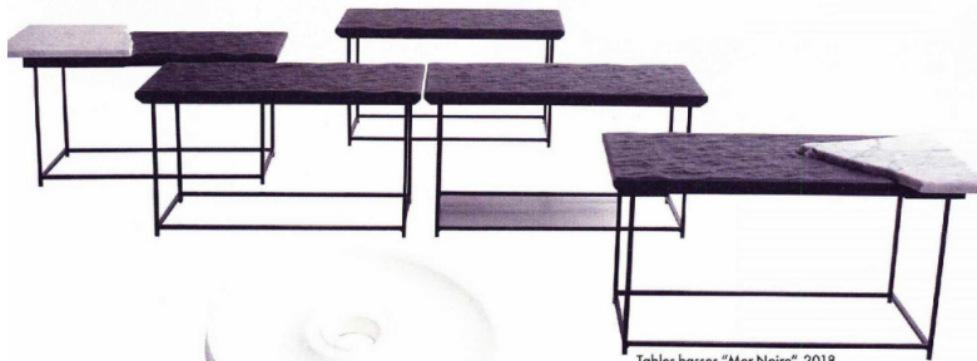
Tables basses "Mer Noire", 2018.